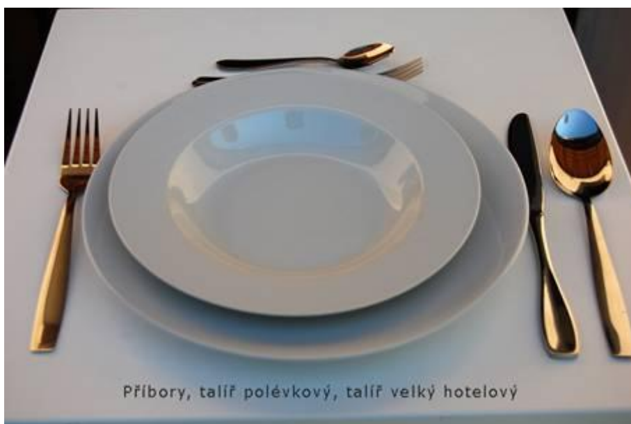
Příbory, talíř polévkový, talíř velký hotelový