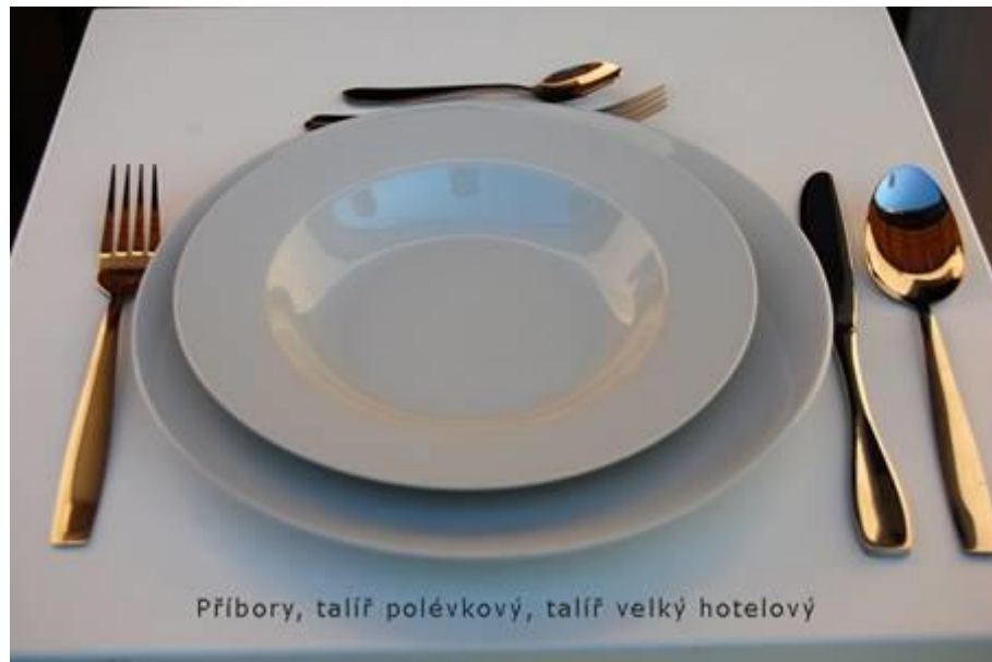
Příbory, talíř polévkový, talíř velký hotelový