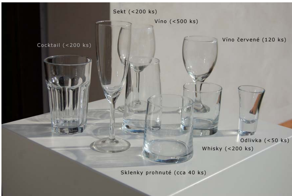
Cocktail (<200 ks)