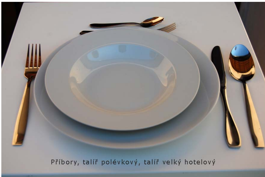
Příbory, talíř polévkový, talíř velký hotelový